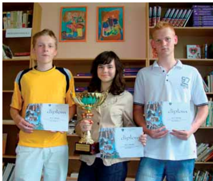
Vítané družstvo 1. ročníka vedomostnej súťaže „Bez ťaháka o ...“