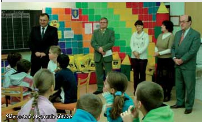
Slávnostné otvorenie súťaže

Tak ako aj po iné roky aj na sklonku kalendárneho roka 2009 sa uskutočnil v poradí už 3. ročník vedomostnej súťaže družstiev žiakov prvého stupňa základných škôl o putovný pohár primátora mesta Topolčany Top oriešky , ktorého