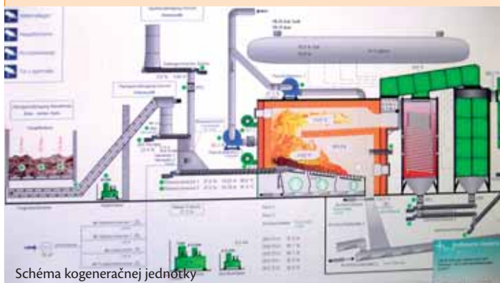
Schéma kogeneračnej jednotky