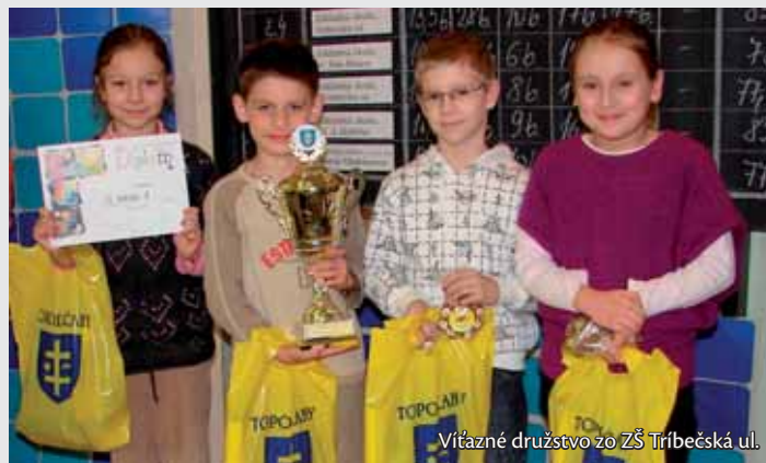
Vítané družstvo zo ZŠ Tribečská ul.

Súťaž odzrkadlila kvalitné schopnosti, vedomosti a úsudok žiakov. Priebeh podujatia bol mimoriadne dramatický. Do posledných chvíľ boli šance na dobré umiestnenie veľmi vy-