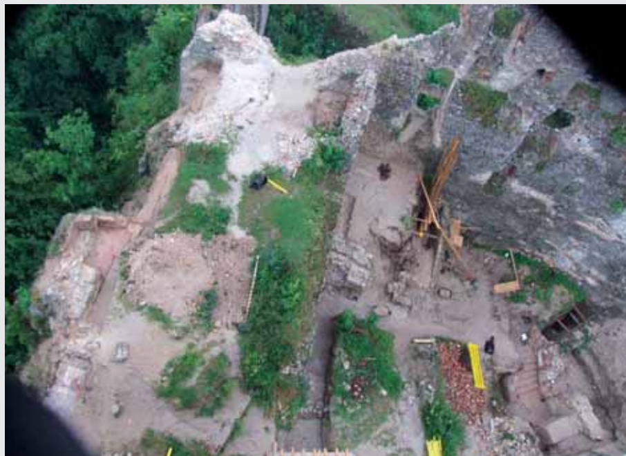
Pohľad na výskum z hradnej veže

veža - donžon. Hlavné snaženie odborníkov podieľajúcich sa na výskume bola príprava základov pre nasledujúcu rekonštrukciu. Konkrétne bolo potrebné preskúmať mohutné vrstvy sutín, ktoré za posledných približne 280 rokov pokryli celý areál, výrazne zmenili jeho charakter a ukryli pod sebou zvyšky hradných budov a ďalších súčastí hradu. Zároveň bolo potrebné zistiť historické úrovne nádvorí a komunikácií hradného jadra, aby zrekonštruovaný hrad získal väčšinu pôvodných priestorových dimenzií, a aby ho návštevník mohol vnímať vo svojej takmer pôvodnej mohutnosti. Počas výkopových prác na výskume, ktoré trvali od apríla do augusta sa väčšinu cieľov podarilo naplniť a výskum priniesol aj mnohé prekvapenia. Veľký význam má komplexné odkrytie celého pôdorysu renesančného plášťového paláca, s ktorého výstavbou sa začalo niekedy okolo roku 1600. Palác, ktorý sa nachádza v južnej časti nádvorí, predstavoval vo svojej dobe najreprezentatívnejšie obytné priestory. Skutočným prekvapením bol objav takmer neporušených priestorov suterénu, do ktorých archeológovia vstúpili po vyše dvoch storočiach. Zrekonštruované a prístupné priestory suterénu sa určite stanú jedným z lákadiel pre návštevníkov hradu. Na omietke oporného piliera paláca sa našiel vyrytý nápis s menom Stephanus Stretz a rokom 1681. Okrem renesančného paláca zamerali archeológovia svoje snaženie aj na severovýchodný trakt staršieho, gotického paláca. Tu sa podarilo zachytiť a preskúmať zvyšky dlážky prvého poschodia a arkierové