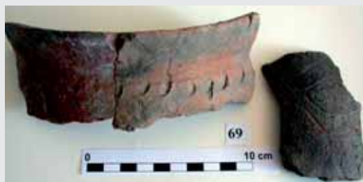
Zlomky stredovekých hlinených nádob.

12. storočia už boli mince vtedajších vládcov Uhorského kráľovstva medzi obyvateľmi štátu veľmi rozšírené. Využívali sa na uskutočňovanie miestnych aj väčších obchodov. Dokonca sa mohla nimi platiť aj povinná ročná daň. Predtým sa platila iba naturáliami, ako rôznymi poľnohospodárskymi a remeselníckymi výrobkami. Na rozdiel od svojich predchodcov Bela III. výrazne skvalitnil