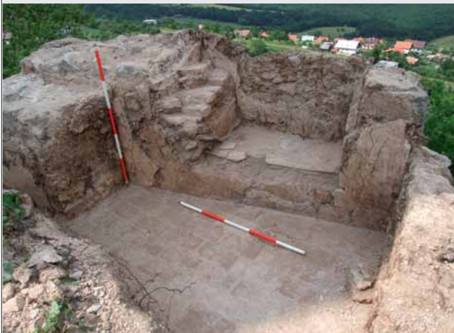
Arkierové okno s pôvodnou dlážkou, severovýchodné krídlo paláca

okno na severnej strane, ktoré budú súčasťou plánovanej vyhladkovej terasy. Na terasu sa návštevník dostane od vstupnej brány priestorom pôvodného schodiska, ktoré však zostane z dôvodu masívneho poškodenia ukryté pod novou konštrukciou. Nový dojem bude tvoriť aj brána, ktorá bola odkrytá v celom pôdoryse a po rekonštrukcii získa späť svoju pôvodnú mohutnosť. Na parkane sa podarilo odkryť zvyšky strážnice, či „mostovej“ veže, ktorá sa nachádzala v mieste vyústenia vstupného mosta, a o ktorej existencii neboli najmenej informácie. Zároveň boli preskúmané aj násypy, ktoré pôvodne slúžili posádke hradu ako ochodze, a vyčistená bola aj delová bašta na severozápadnom ukončení parkanu. Množstvo nálezov dokladajúcich každodenný život na hrade musí byť ešte dôkladne odborne spracované. Avšak už dnes vieme, že niektoré úplne zmenia pohľad na dejiny a vývoj hradu. Napríklad z násypov na parkane pochádzajú zlomky kachlíc z pece, ktoré sú zdobené erbom Stibora zo Stiboríc. Prítomnosť tohto šľachtica (ako hodnostár cisára Žigmunda Luxemburského sa zúčastňoval na bojoch proti husitom) na hrade priamo vylučuje prítomnosť husitskej posádky, ktorá v skutočnosti ovládala mesto Topolčany. Mladšie obdobie, keď hrad vlastnili Forgáčovci z Gýmeša, je charakteristické množstvom veľmi kvalitného hrnčiarkeho materiálu (kachlice, úžitková keramika), ale aj sklenených predmetov, ktoré dokladajú vysokú úroveň komfortu v prostredí jedného zo