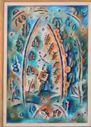
Quercus et Populus