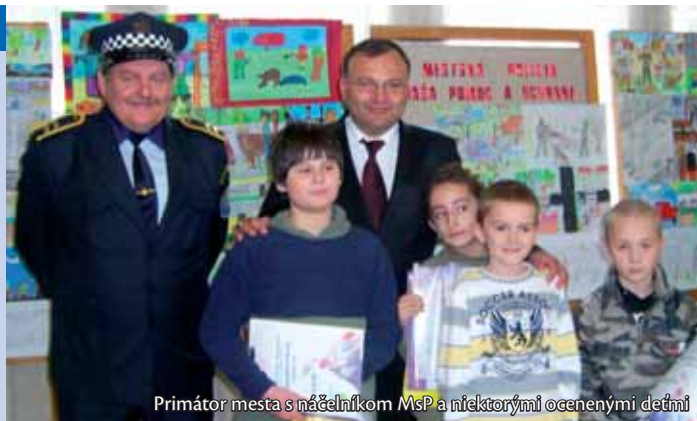
Primátor mesta s náčelníkom MsP a niektorými ocenenými deťmi