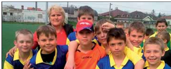
Šťastní víťazi zo ZŠ Gogoľova ul. tohoročného turnaja mladých futbalistov.

Už 12. ročník futbalového turnaja O pohár primátora mesta Topoľčany žiakov do 4. ročníka ZŠ sa v jarných mesiacoch toho roku odohral na futbalovom štadióne V. Schotterta v Topoľčanoch. Mesto v spolupráci s MFK Topvar a hlavným organizátorom Centrom voľného času Topoľčany pre