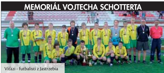
Víťazi - futbalisti z Jastrzebia