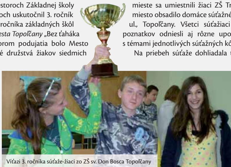
Víťazi 3. ročníka súťaže-žiaci zo ZŠ sv. Don Bosca Topoľčany

Dňa 2. júna 2010 sa v priestoroch Základnej školy na Gogolovej ulici v Topoľčanoch uskutočnil 3. ročník vedomostnej súťaže žiakov 8. ročníka základných škôl O putovný pohár primátora mesta Topoľčany „Bez ťaháka o . . .“ . Tradičným organizátorom podujatia bolo Mesto Topoľčany. Trojčlenné súťažné družstvá žiakov siedmich topoľčianskych základných škôl a družstvo žiakov zo ZŠ s MŠ Horné Obdokovce odpovedali v každom zo šiestich súťažných kôl na súbor štyroch vedomostných úloh (otázok), ktoré boli usporiadané podľa náročnosti, od najľahšej otázky po najťažšiu otázku. Tematické zameranie otázok sa postupne zužovalo od svetového diania, cez problematiku Európy, Slovenska, nitrianskeho regiónu, až k informáciám o meste Topoľčany. Víťazom 3. ročníka súťaže „Bez ťaháka o . . .“ sa stalo súťažné družstvo žiakov ZŠ sv. Don Bosca Topoľčany, ktoré získalo Putovný pohár primátora mesta Topoľčany . Na druhom