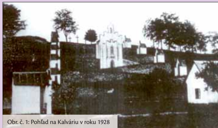
Obr. č. 1: Pohľad na Kalváriu v roku 1928

Ing. arch. Eva Gažiová, metodik pamiatkového úradu