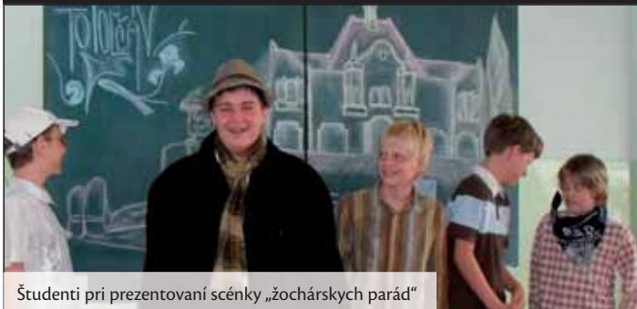
Študenti pri prezentovaní scény „žochárskych parád“

Dňa 7. mája 2010 prezentovali študenti Súkromného jazykového gymnázia v Topoľčanoch svoj projekt s názvom Topoľčany očami študentov . Mladí ľudia so záujmom i s humorom sebe vlastným podali svoj pohľad na kultúru, školstvo, architektúru, históriu vzniku, archeologické nálezy, osobnosti a ďalšie aspekty života mesta a jeho občanov. Projekt prezentovali v prítomnosti predstaviteľov mesta Topoľčany, Spoločného školského úradu, Tribečskej knižnice a Tribečského múzea. Prezentácie zazneli v nemeckom a v anglickom jazyku. Súčasťou prezentácie bola záverečná beseda s viceprimátorom mesta Topoľčany, ktorá študentom poskytla ďalšie informácie súvisiace z históriou mesta a jej súčasnosťou. Milým osviežením bolo vystúpenie malých študentov osemročného štúdia školy, v ktorom predvedli svoje „žochárske parády“. Prostredníctvom tvorby projektu mali aj študenti dochádzajúci na štúdium z iných miest, možnosť spoznať históriu a neopakovateľnú atmosféru mesta Topoľčany.