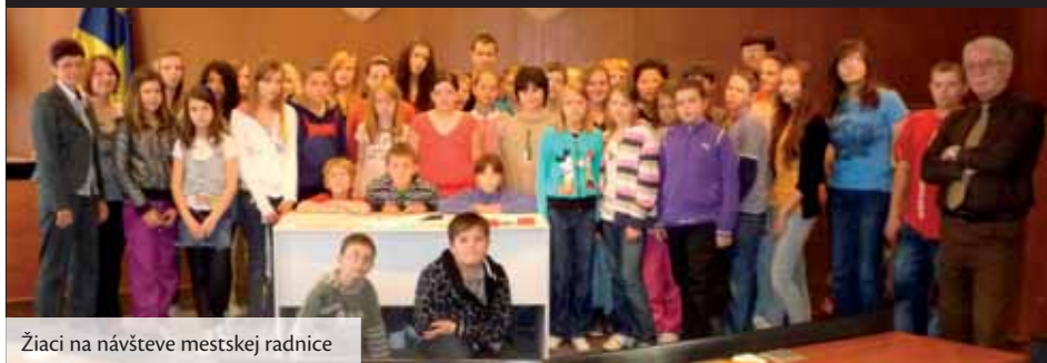
Žiaci na návšteve mestskej radnice

Posledné týždne v Základnej škole, Gogolova 2143/7, Topoľčany boli bohaté na rôzne akcie pri príležitosti významných dní. Škola v tomto období žila čulým ruchom.