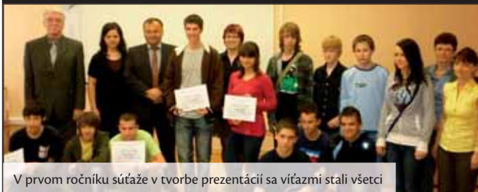
V prvom ročníku súťaže v tvorbe prezentácií sa víťazmi stali všetci

V stredu 5. mája 2010 sme privítali v našej Základnej škole na Gogoľovej ulici v Topoľčanoch šesťnásť súťažiacich žiakov zo základných škôl školského obvodu Topoľčany. V zmodernizovanej učebni informačno-komunikačných technológií, si svoje tvorivé sily vo vytváraní prezentácií v počítačovom programe PowerPoint 2007 zmerali a svoje práce následne aj odprezentovali porote i prítomným hosťom.