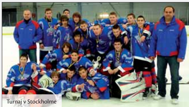
Turnaj v Stockholme

Po tomto turnaji sa družstvo pripravovalo na ďalší medzinárodný turnaj v Helsinkách, na turnaji v Prahe, kde obsadilo pekné druhé