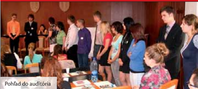
Pohľad do auditória

Medzinárodný projekt Modelový európsky parlament (MEP) organizuje Ministerstvo školstva SR prostredníctvom Metodicko-pedagogického centra v Bratislave. MEP je projektový spôsob učenia sa, ktorý prostredníctvom „hry na poslancov“ umožňuje žiakom stredných škôl vo veku 15 – 17 rokov zdokonaľovať sa v komunikačných a argumentačných zručnostiach. Organizuje sa na regionálnej, národnej a medzinárodnej úrovni. Projekt MEP je v Nitrianskom kraji z roka na rok úspešnejší. Aj v tomto roku sa do projektu k deviatim pôvodným školám zapojili ďalšie dve nové školy. Potešiteľné je, že z jedenásť zapojených škôl Nitrianskeho kraja je až päť stredných škôl z Topolčian,