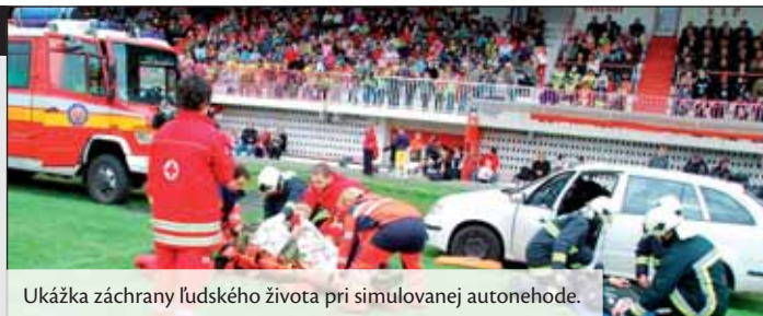
Ukážka záchranu ľudského života pri simulovanej autonehode.

Hasičský záchraný zbor malých divákov zaujal ukážkou hasenia horiaceho havarovaného automobilu a uvoľňovania zranených osôb z neho.