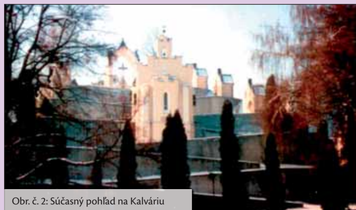
Obr. č. 2: Súčasný pohľad na Kalváriu