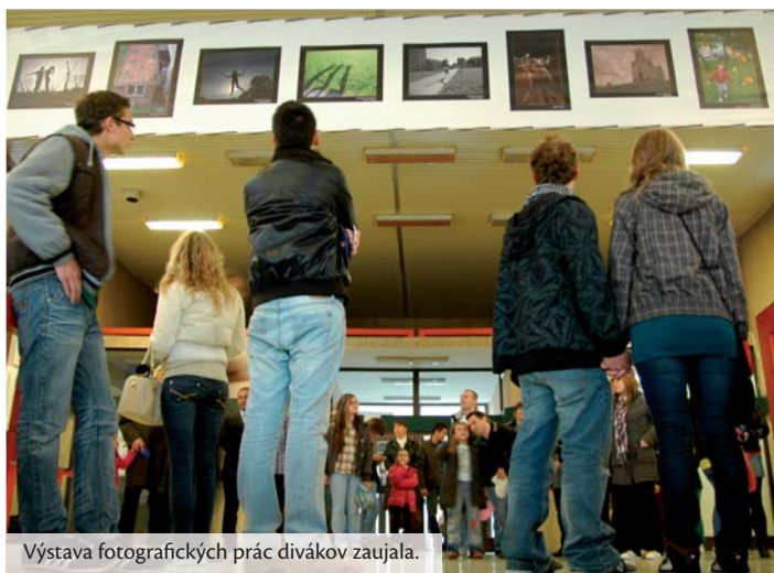
Výstava fotografických prác divákov zaujala.

Ing. Jozef DALLOŠ, riaditeľ VNĽŠ