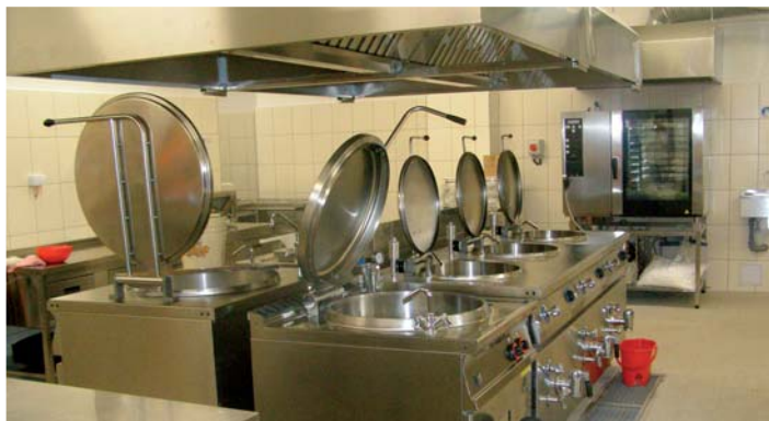
Celkový pohľad do interiéru kuchyne, kde sú inštalované moderné varné kotle s veľkoplošným digestorom a v pozadí je moderný konvektomat.

nahradená vysokovýkonnými veľkoplošnými digestormi, ďalej boli nainštalované moderné varné kotle a konvektomat na veľkokapacitné pečenie múčnikov. Celková dodávka zariadenia kuchyne predstavovala čiastku 176.051,63 € s DPH. Kompletná rekonštrukcia pôvodnej budovy a prístavba pavilónu (s modernými špeciálnymi učebňami) základnej školy bude podľa zmluvy ukončená najneskôr do 31. januára 2011.