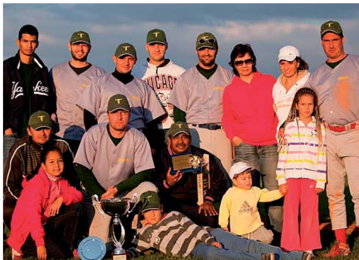
Pohľad na topoľčianskych baseallistov, účastníkov tunaja TOREROS CUP 2010.

sveta. Je veľmi sympatické, že v oblasti darcovstva je boj proti hladu jednou hlavných priorit tejto spoločnosti. Formou priamej pomoci,