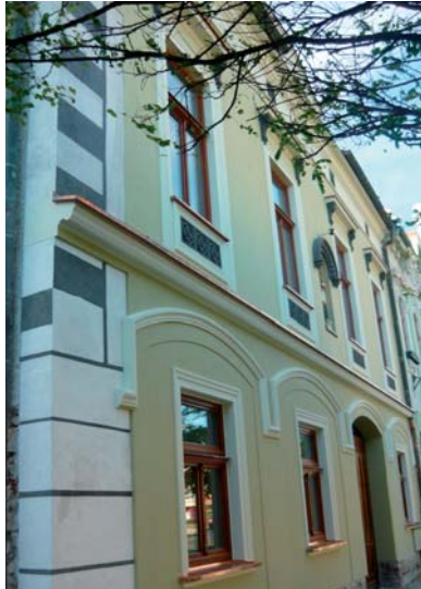
Pohľad na kompletne zrekonštruovanú fasádu Farského úradu s pôvodnou omietkou.

Posledná úprava fasády bola realizovaná v 80-tych rokoch 20. storočia a pozostávala z opravy poškodenej eklectickej omietky (19. stor.) a naniesenia nového okrového náteru, ktorý si pamätáme na fasáde pred jej obnovou. Výskumom bolo zistené, že omietka, pochádzajúca zo 17. storočia, sa zachovala na celom východnom nároží a čiastočne i na západnom nároží fasády. Malovaná výzdoba pozostávala z iluzívneho kvádrovania čierno-bielej farebnosti, zachoval sa i malbou naznačený predel poschodí a viditeľné bolo aj jasné ukončenie omietky, ktorá bola ukončená 1,3 metra pod dnešnou korunnou rímsou. Toto dokazuje, že budova bola následnými stavebnými úpravami, možno niekedy v 18.-19. storočí, zvýšená, resp. nadstavovaná. Výskum upresňuje i historický údaj súvisiaci s rokom výstavby budovy – 1765. Na základe nálezu omietky, pochádzajúcej zo 17. storočia, je možné konštatovať, že v danom roku 1765 nešlo o výstavbu budovy, ale o väčšiu prestavbu už existujúcej budovy.