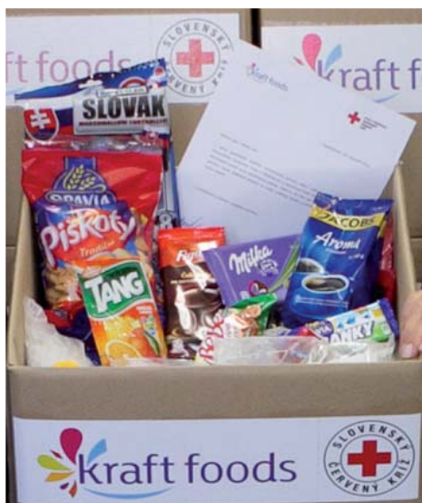
Potravinové balíčky na pomoc rodinám s deťmi v hmotnej núdzi.

S ročným obratom dosahujúcim približne 48 mld. dolárov patrí spoločnosť Kraft Foods medzi najväčšie svetové potravinárske veľmoci v sortimente snackov, cukrovíniiek a rýchleho občerstvenia. Ako druhá najväčšia potravinárska spoločnosť na svete Kraft Foods vyrába vynikajúce produkty pre svojich spotrebiteľov vo viac ako 160 krajinách